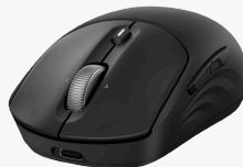
HP 700 laddningsbar trådlös mus AZ7B0AA