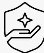
3 års hämtning och retur UM963E