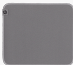
HP 100 Sanitizable musmatta 8X594AA