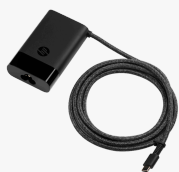
HP USB-C 65W Laptop Charger 671R2AA