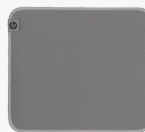
HP 100 Sanitizable musmatta 8X594AA