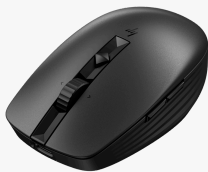
HP 710 Rechargeable Silent Mouse 6E6F2AA